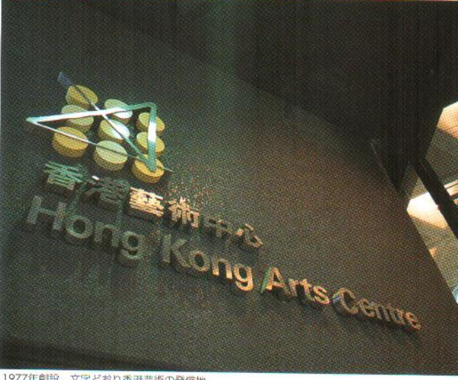
1977年創設。文字どおり香港芸術の発信地

ホール/劇場 Map_灣仔・銅鑼灣A-2 芸術を振興する 多様な施設を完備 香港藝術中心 ホンコン・アーツ・センター Hong Kong Arts Centre 公演、展示により異なる 祝