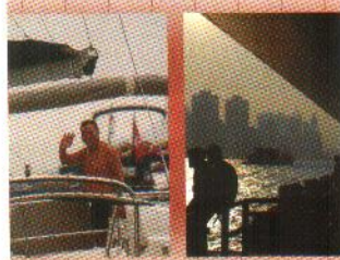
香港を語る上で欠かせない港。 香港島の南には クルーズ船が並ぶ港も。