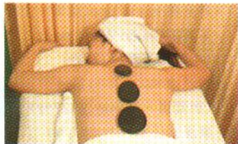
この岩石には、体内に溜まった負のエネルギーを放出する効果があるのだとか