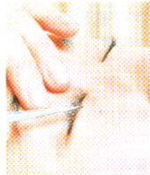
日本製SILKYLASHを使用、効果が長持ちするのでマスカラも不要

中でも温めた岩石を体に置くことで体内エネルギーのバランスを整える効果が期待できる「熱石」(1時間$350~)と、自然な仕上がりが2~3週間続く「まつ毛エクステンション」はおすすめ。